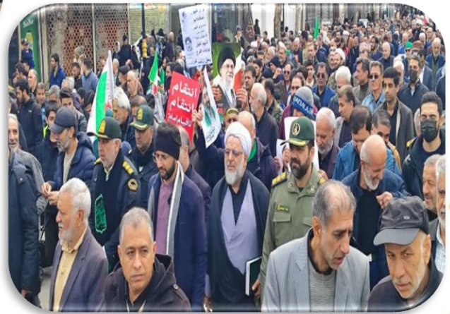
در راهپیمایی روز قدس