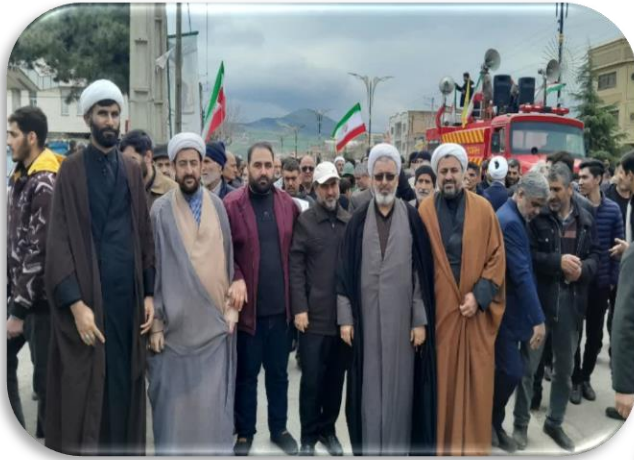
حضور کادر و اساتید و طلاب