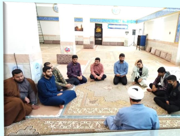
برگزاری جلسات ادعیه و زیارات